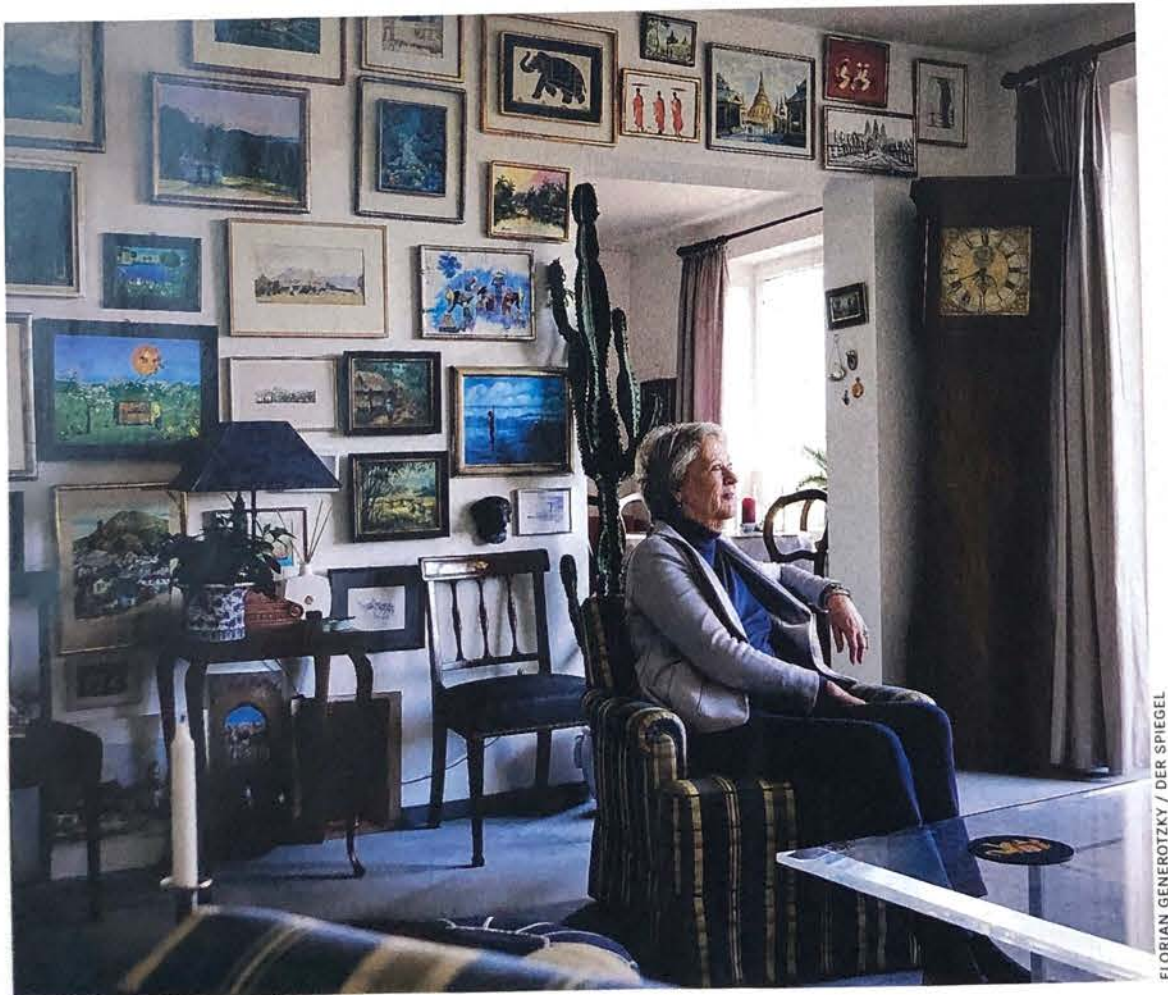
Rentnerin W.: »Alles ging ruckzuck«

Beim Nießbrauch wie im Fall der Münchner Rentnerin wird die Immobilie